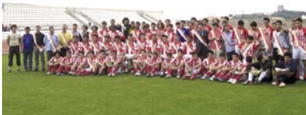
A foto final! Todos os elementos da equipa e responsáveis. O dia foi de festa