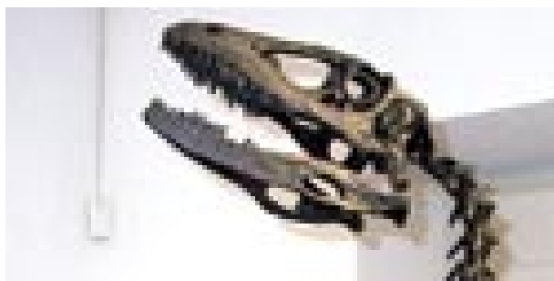
Algumas das peças em exposição

Esta mostra abriu ao público no passado dia 8 de Julho e estará patente até 7 de Setembro, todos os dias, das 10 às 23h00.