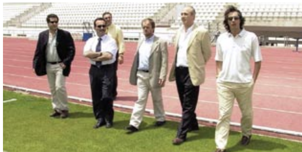
A Comitiva da Sociedade Euro 2004 conheceu de perto as instalações