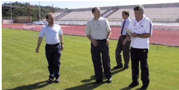
Visita do seleccionador Francês à direita ao Complexo Desportivo