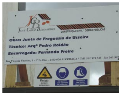
12 - Nova sede da Junta da Usseira