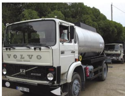
10 - Novo equipamento adquirido pela autarquia para alcatroamento