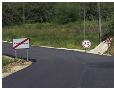
3 - Estrada da Gracieira - Gaeiras - obras de pavimentação já concluídos