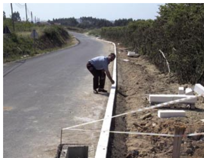
9 - Construção de novos passeios (Gaeiras)