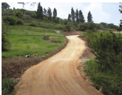
5 - Abertura e limpeza de caminhos agrícolas, trabalhos já concluídos