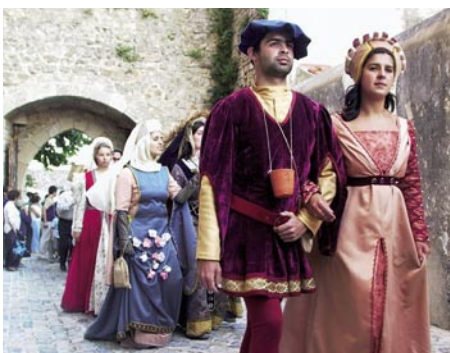
7 - Todos os nobres desta "corte" puderam passear pelas ruas de Óbidos