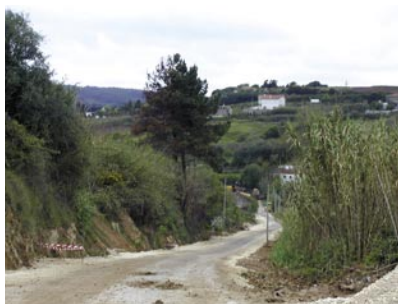
2 - Estrada da Gracieira, freguesia das Gaeiras - obras de pavimentação (antes)