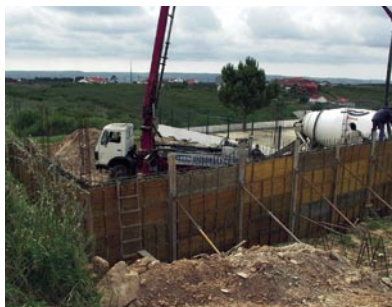
11 - Nova sede da Junta de Freguesia da Usseira e edifício polivalente. Um investimento de 250 mil euros