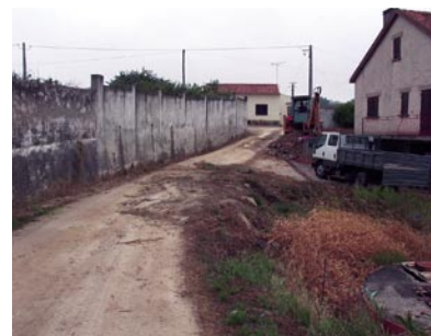
13 - Alargamento da rua das Pombas, em A-da-Gorda, um anseio da população com décadas