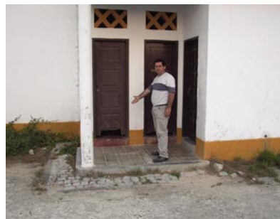
14 - Feito um levantamento pela CMO, o orçamento para pequenas reparações em escolas de ensino básico e jardins de infância ultrapassa os 2 milhões de euros