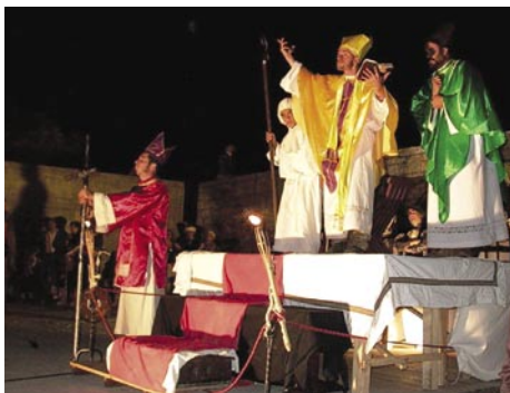
4 - Auto de Fé: um espectáculo interactivo muito aplaudido pelo público