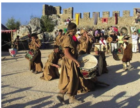
6 - Alegria e boa disposição com música medieval