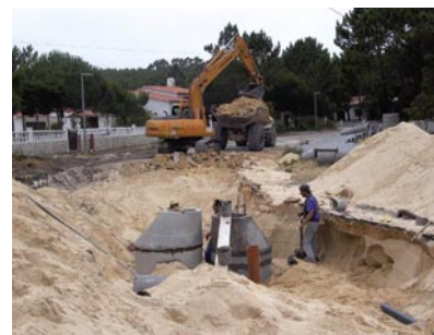
7 - Obras no Bom Sucesso