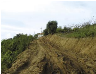
4 - A autarquia tem feito um grande investimento na abertura e limpeza de caminhos agrícolas (antes)