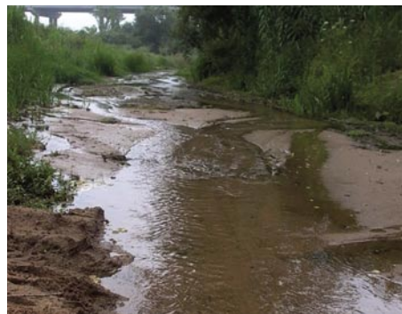
4 - O Rio Arnóia, local onde vai ser construída a barragem