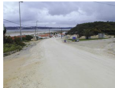
6 - O saneamento no Bom Sucesso está a avançar. Um investimento superior a 2,5 milhões de euros para um problema com mais de 30 anos