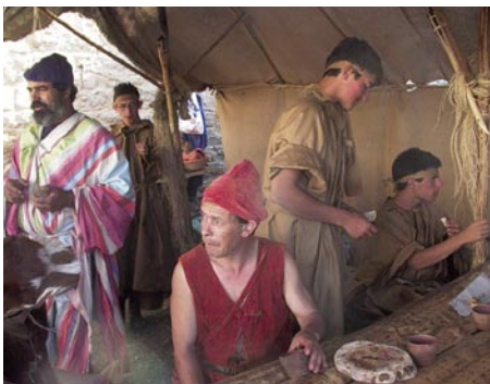
5 - Gastronomia: este foi um dos sectores do mercado mais visitado